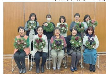
世界に一つだけのリース

親睦委員会主催により、クリスマスリース作りワークショップを開催しました。講師は、女性会会員でもあるフラワーショップキクチさんにお越し、サツマ杉の深い緑に白みがかかったブルーアイスを組み合わせた冬らしいリースに、コットンや松ぼっくり、リボンなどを添え、それぞれが工夫を凝らし制作しました。同じ材料を使用していても完成したリースは一つひとつ異なり、個性あふれる作品が出来上がりました。制作中は和やかな雰囲気の中で会話が弾み、手づくりの温かさを感じながら、親睦を深める良い機会となりました。