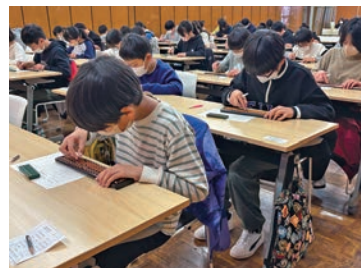
一球一球に思いを込めて そろばんに挑む選手たち