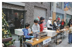
小学生たちの職場体験の様子