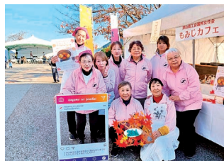
絆が深まったもみじカフェ

会員同士の交流も深まり、「楽しかった」との声も聞かれ、地域の行事に参加しながら、会員同士の絆を育むことができたことは大きな喜びです。今後も、色々な活動を通じて、地域の皆さまとのつながりを大切にしていきたいと思います。