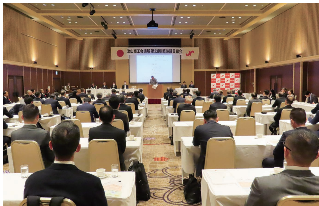
臨時議員総会の様子