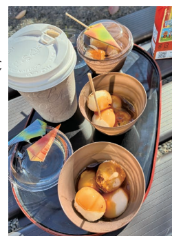
みたらし団子大好評！