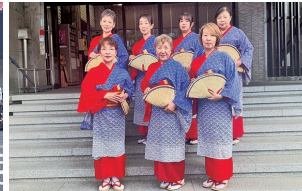
野村会長以下7名参加