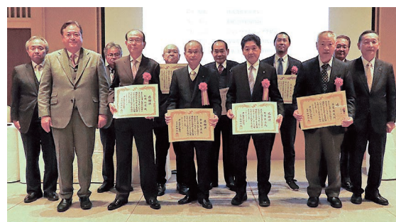
正副会頭と 役員議員退任表彰者