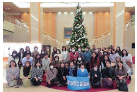
リーガロイヤルホテルの X'mas ツリーの前で

共済制度ご加入者を対象にした「共済還元日帰りバス旅行」を実施しました。今回の旅行では、劇団四季の名作ミュージカル『キャッツ』の観劇と、リーガロイヤルホテル広島での豪華な昼食ビュッフェを楽しんでいただきました。参加者の皆様からは、「感動的な舞台を間近で観られてよかった」「ホテルのビュッフェがとても美味しかった」など、たくさんの喜びの声をいただきました。また、日帰り旅行という気軽さも好評で、リフレッシュの機会として楽しんでいただけたようです。これからも、共済制度ご加入者の皆様への感謝の気持ちを込めたイベントを企画してまいります。