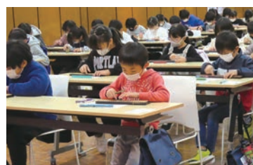
気持ちを集約させて 大会に挑む選手達