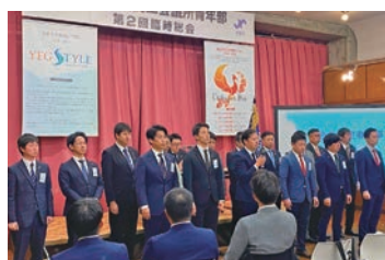
次年度役員予定者

これらの事業に精一杯取り組み、新年度体制へ素晴らしいバトンが渡せるよう邁進して行く所存です。