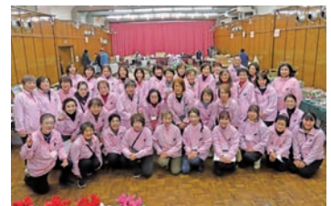
準備〜当日まで延べ50名が参加

これを通じて、地域の方々との交流ができ、貴重な良い機会になりました。ご協賛いただきました企業様、ご協力、ご尽力いただきました皆様に心より御礼申し上げます。