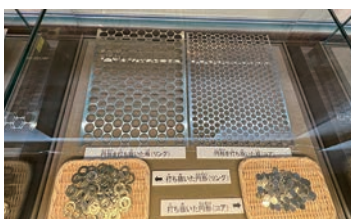
新500円玉の製造過程の展示

総じて、工場内の製造ライン見学もさることながら、それにとどまらず、企業の歴史や創業者の思い、そしてこれからの未来へ向けた、技術力の進化に驚かされる研修となりました。