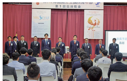
令和7年度役員予定者