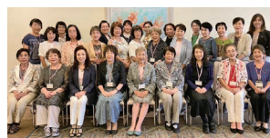
野村会長以下27名参加