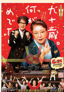
▲映画「九十歳。何がめでたい!」 11月22日(金)~ 23日(土・祝)