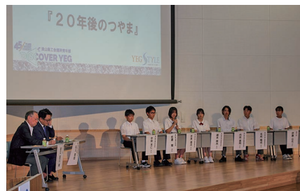
創立45周年記念事業の様子