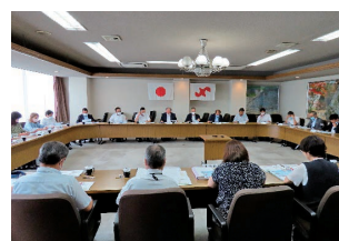
津山市による現状説明