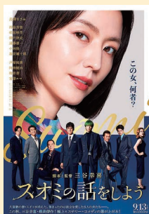
▲映画「スオミの話をしよう」 11月3日(日・祝)~ 4日(月・振替)