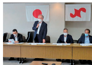
部会長並びに委員長

参加メンバーの医療・福祉事業者の視点では、団塊の世代が75歳以上になる2025年問題による「人手不足」「施設不足」が喫緊の課題となっている現状の説明があり、意見交換を重ねる中で、地域包括ケアシステムのさらなる充実に向けて、今後も津山市と協力・連携していくことを確認しました。