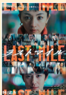
▲映画「ラストマイル」 10月19日(土)~20日(日)