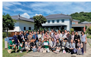
津山洋学資料館にて