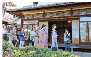
城東むかし町家(旧梶村邸) 見学

これを機に、他の女性会とも交流し、各会の発展に繋げるきっかけとなることを願っています。