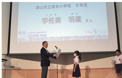
作文コンテスト最優秀賞