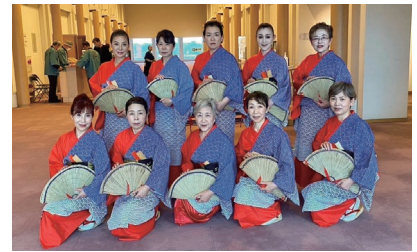
津山商工会議所女性会連

女性会は、津山情緒保存会の設立当初よりともに歩み、この度、記念発表会にて女性会単独の踊り連として10名で出演しました。全踊り連の練習に加え、発表時のフォーメーション等の指導を賜り、本番では最高の発表を行うことができました。客席から熱い声援を送ってくださった皆様に、心より御礼申し上げます。今後も、保存会の皆様と共に、地域を盛り上げ、伝統文化の継承に貢献できるよう、精進してまいります。