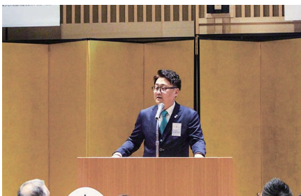
第34代 石川会長挨拶

令和6年度通常総会・懇親会ではご来賓・OB会・現役を含め145名の参加となり、多くの方々の期待を今後も超えていくよう「YEG STYLE～地域を彩り今を輝く～」のもと、メンバー一丸となり歩んで参ります。