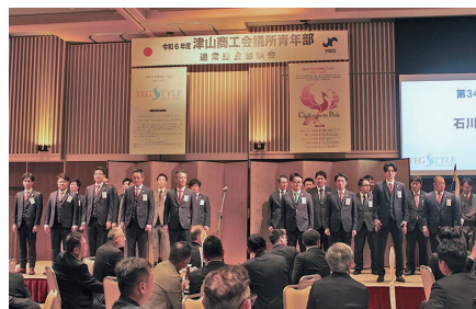
通常総会懇親会の様子