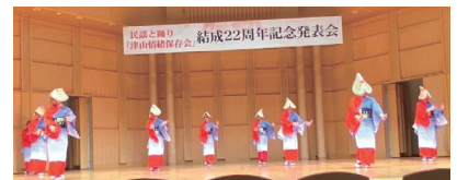
津山情緒・津山民謡を披露