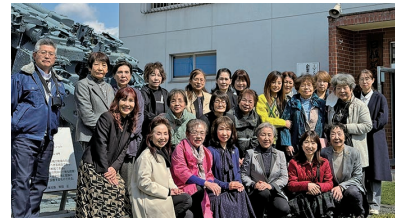
日植記念館前にて