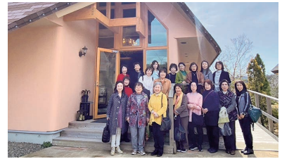
オーベルジュ フレンチの森

最後に「たこせんべいの里」と「淡路ハイウェイオアシス」でお土産を購入し、帰路につきました。久しぶりの親睦旅行となり、楽しく有意義な時間となりました。