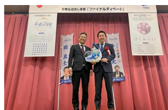
宇治会長と卒業生