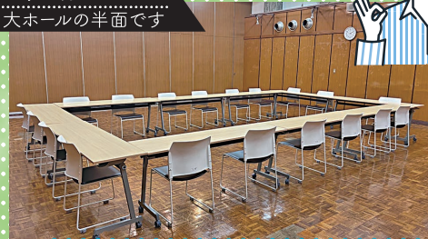
Bホール 大ホールの半面です

大人数が収容できる大ホールは、天井も高く、機材の搬入・搬出にも便利! 展示会場にとっても最適です。