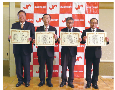
永年表彰された皆様