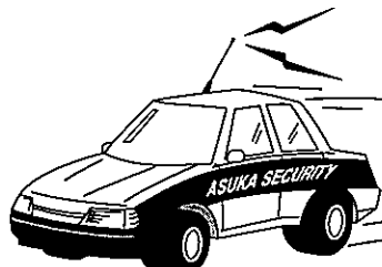
アスカセキュリティ機動部隊 異常事態の強い味方。

津山市は提案内容を今後の検討に反映させる方針で、当面は、街区Cの旧ホテル跡地について、活用計画を年度内にまとめる。